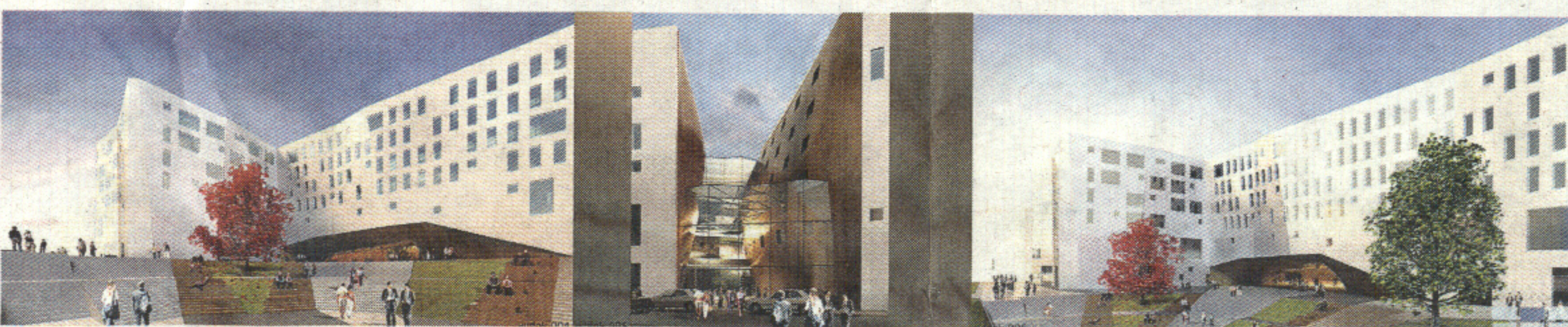
Autorska Pracownia Architektury Kuryłowicz & Associates była chwalona m.in. za rozplanowanie lobby hotelowego i foyer centrum konferencyjnego